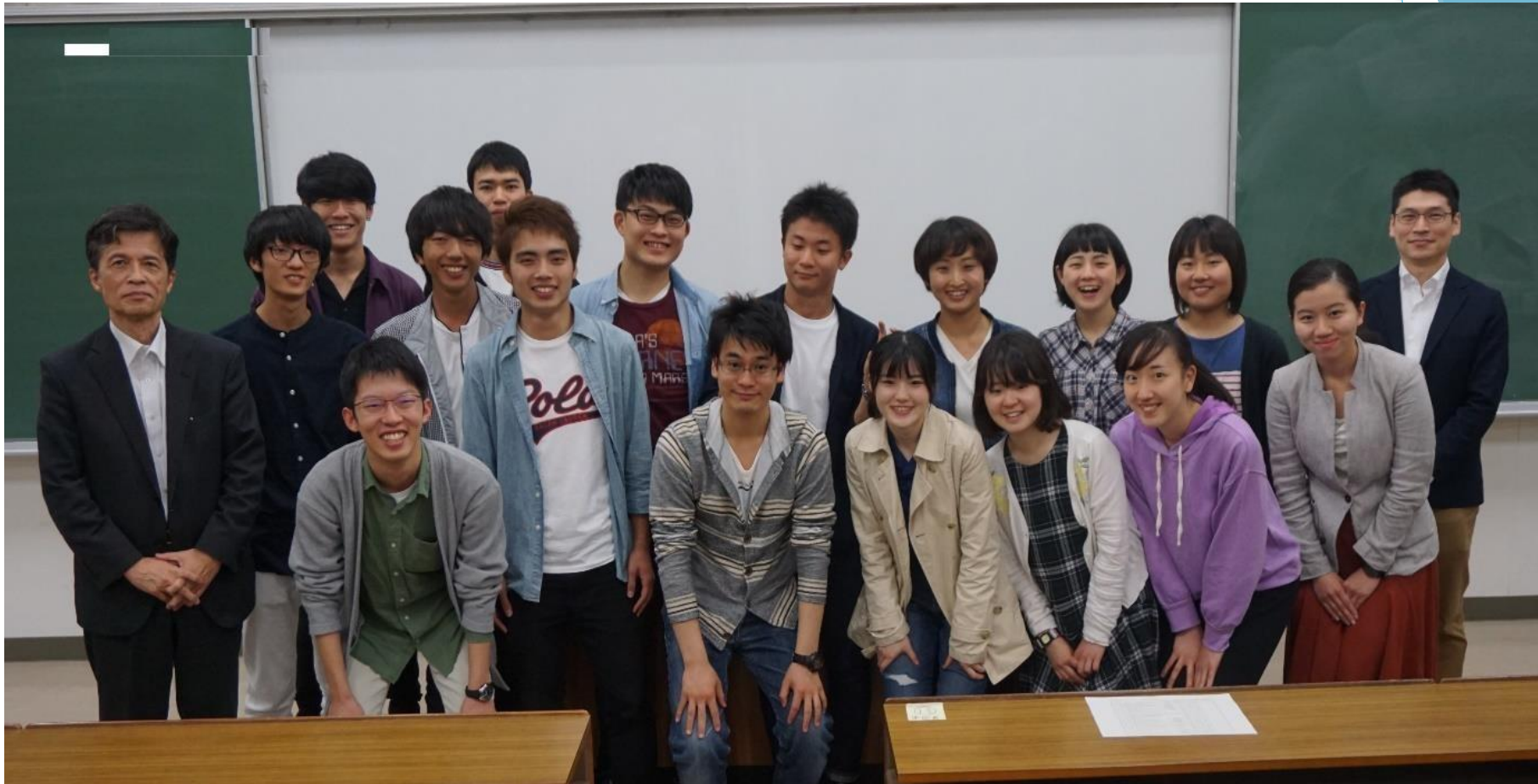
2018年度派遣された16名の皆さん