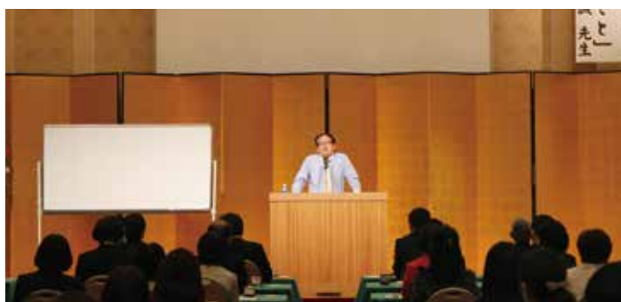
記念講演いただいた上野教授(奈良大学)