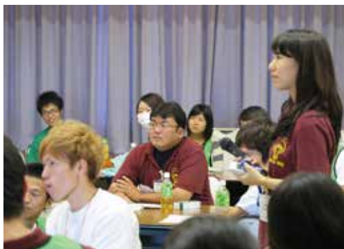
災害医療セミナー

の被害で住宅が流されたままの状況が残っていたり、ガードレールが曲がったままだったり、震災の爪痕を目にしました。最近では原子力発電所のことしかニュースで取り上げられていませんが、津波や地震の被害はまだ残っていて、復旧・復興が進んでいないということを多くの人に伝えていきたいです。また、福島医大では災害医療について学び、将来医療従事者になったときどのようなことができるのかを考えさせられました。今後、学生災害ボランティアの一員として、学祭や勉強会を通して多くの人に震災に対し興味を持ってもらえるよう活動をしていきたいです。