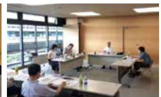
8月12日「第2回評価委員会」