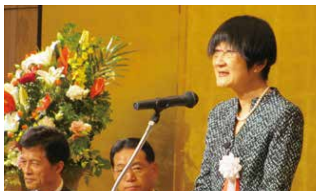
軸丸看護学科長の経過報告