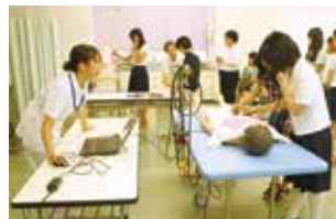
看護学科 実習室(成人看護学)

見学では、昨年11月にオープンしたばかりの新病棟にある放射線治療室で最新の放射線治療装置(リニアック)を見学し、参加者は担当の先生の説明を聞き、最新の設備を熱心に見入っていました。