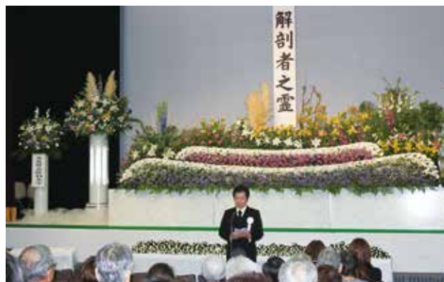
御礼の言葉を述べる細井学長

医学の発展と医学教育のために自らの体を捧げてくださった方々の崇高なご遺志に改めて深い感謝の意を表しますとともに、心よりご冥福をお祈り申し上げます。