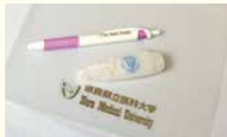
医大ロゴ入りグッズ

医大ロゴ入りグッズは使っていますか。青、緑、ピンクなど6色を揃えたボールペンは、大変書きやすいと評判です。修正テープやクリアホルダーも重宝されています。