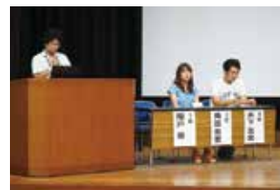
医学科 先輩からのメッセージ

毎年盛況の『施設見学』では、日頃学生が実験や実習を行っている実験施設や実習室、また附属病院の高度救命救急センター、MRI、メディカルバスセンター等の各施設や病棟などを見学しました。2日の医学科の施設