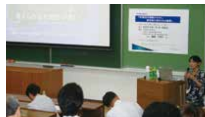
参加者から多くの質問も出されました

今後も年 1～2 回程度開催し、本学研究者の倫理的観点の更なる向上につなげていきたいと思っております。