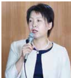
講演頂いた里見課長