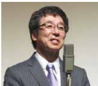
細井学長あいさつ