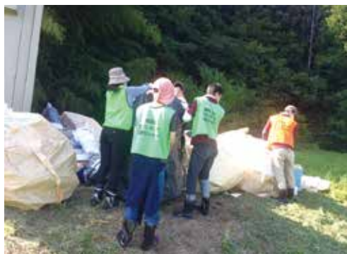
現地での作業の様子