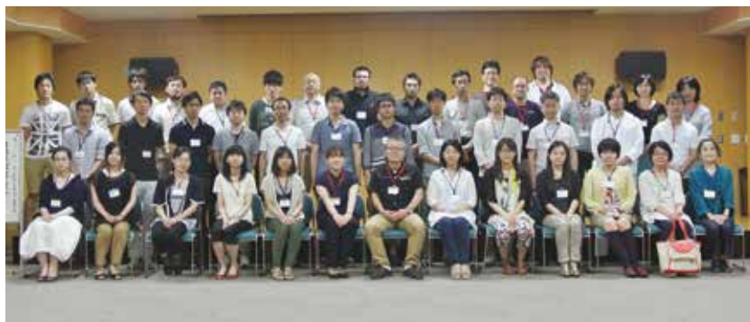
研修会を終えて全員集合