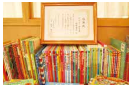
いただいた絵本と感謝状