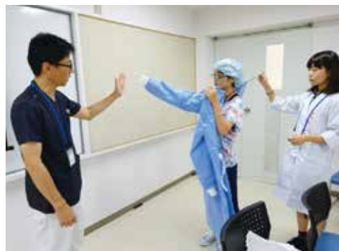
第3回ガウンテクニック実習の様子

各回には本学医学科学生もティーチングアシスタントとして参加し、実習の指導だけでなく身近なロールモデルとして女子中高生からの様々な質問に親身に答える姿も多く見られました。