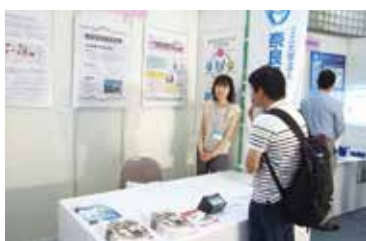
出展ブースの様子

本学出展ブースにも多数の人が訪れました。本学の研究成果を紹介するとともに、他の出展を行っている企業等との交流・情報交換を行いました。