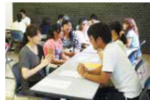
医学科 相談コーナー

『相談コーナー』では、本学の教職員、在学生及び卒業生が、入試のことから学生生活、また卒業後の仕事の様子などについて、受験生や保護者からの様々な相談に応じました。