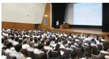
満席となった会場

理事長の総括の中で、知事が本学教職員・学生に講演されるのは創立以来初めてのことと紹介されましたが、今回の講演会は、県や県民の本学への期待の大きさを再認識する機会にもなりました。現在、将来像策定に向けた議論・検討を県と共同で進めていますが、その過程を教職員・学生全員で共有し、ご意見・ご提案をいただきながら、将来像を策定していくこととしていますので、今後ともご協力をお願いします。