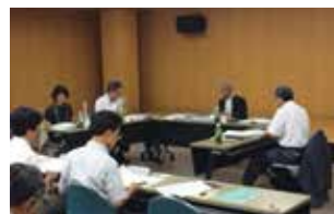
7月31日「第1回評価委員会」

(URL http://www.naramed-u.ac.jp/info/plan_evaluation/business.html )