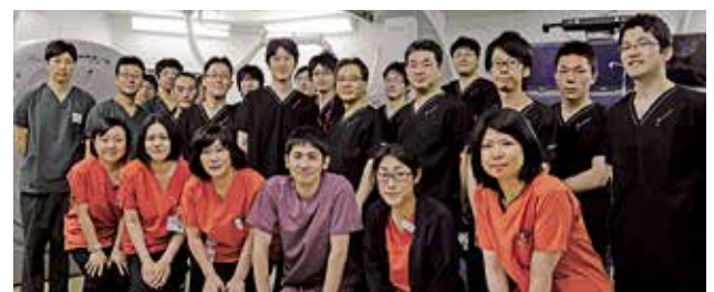
IVRセンタースタッフ

これからの超高齢化社会を迎え、IVRの果たす役割が益々増える中、今後もIVRセンターのスタッフが丸となり、さらなるIVRの発展と普及に向けて日々研鑽に励みたいと思いますので、関係各位のご指導とご協力を宜しくお願い申し上げます。