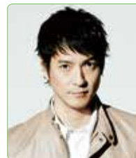
トークショーゲスト 沢村 一樹さん

今年も大学祭の季節が近づいてきました。例年以上に盛り上がるように学祭委員が趣向を凝らしたたくさんの楽しいイベントを開催いたします。