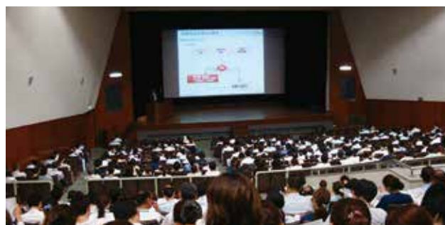
満席となった研修会場