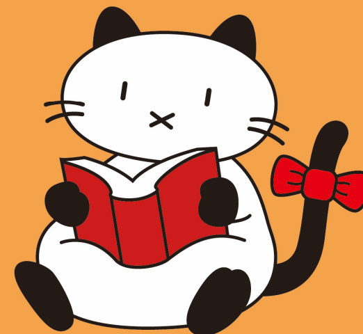
マスコットキャラクター ないとちゃん

開館時間 8:00 ~ 24:00 通常(有人)開館時間 8:30 ~ 17:00(平日)